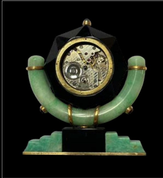
Détail du mouvement.