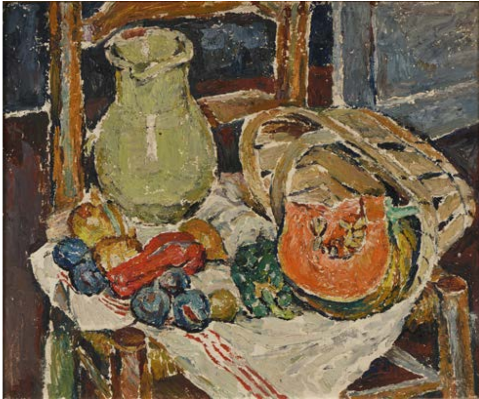
221 Mela MUTER (1876-1967) Nature morte à la citrouille et au pichet. Huile sur toile. (Quelques épidermures) 54 x 65 cm