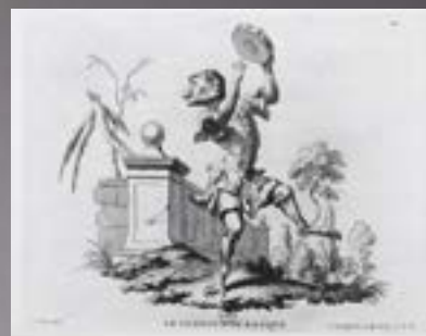
Le tambour de basque, d'après Christophe Huet, gravé par Jean Guelard.