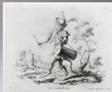
Le tambourin, d'après Christophe Huet, gravé par Jean Guelard.